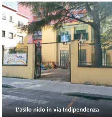
L'asilo nido in via Indipendenza

La cabina di regia regionale assegna a Battipaglia i fondi Pics. Vengono presentati tre macro interventi: Città inclusiva e attrattiva: 7,3 milioni per un hub della dieta mediterranea e per laboratori sociali per associazioni e start up (ex De Amicis), Città low carbon: 3,5 milioni per rifacimento di tutta la pubblica illuminazione; Città per le famiglie: 200 mila euro per la rifunionalizzazione dei tre micronidi comunali. Totale assegnato: 11 milioni di euro. Il ritardo è costato 4 milioni di euro. Da questo momento dovrebbero partire i bandi e le gare.