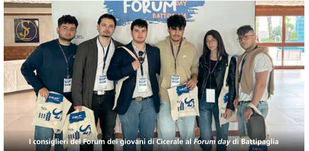
I consiglieri del Forum dei giovani di Cicerale al Forum day di Battipaglia

Proprio nei giorni in cui a Battipaglia si celebrava il Forum day (il meeting dei Forum dei giovani dei comuni della provincia di Salerno), a Cicerale muoveva i primi passi, in municipio, il locale Forum dei giovani. La data di nascita dell'organo consultivo del comune cilentano è 20 ottobre 2023. Il neonato Forum si occuperà principalmente della tutela e della valorizzazione del