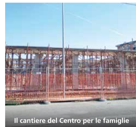
Il cantiere del Centro per le famiglie