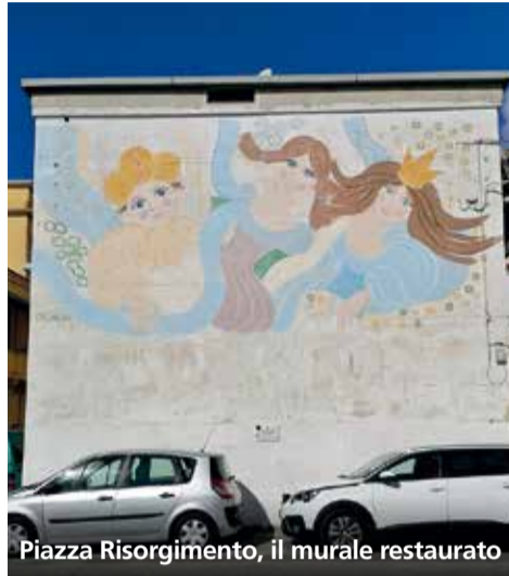
Piazza Risorgimento, il murale restaurato

Già nel 2019, l'associazione a.DNA aveva iniziato questo percorso con il primo intervento di restauro dell'opera realizzata, sempre nel 1984 in piazza Risorgimento, dall'artista Umberto Vota, intitolata L'Albero del Domani . A supportare l'intero progetto SPES è stata la Fondazione Cassa Rurale di Battipaglia.