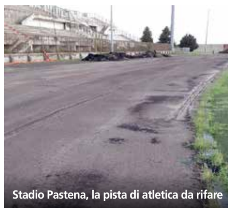
Stadio Pastena, la pista di atletica da rifare

Pubblica illuminazione: le cinque ditte in subappalto stanno lavorando nelle diverse zone della città. Si è partiti dalle aree interessate dal traffico scolastico per evitare problemi all'apertura delle scuole, spostandosi poi verso il centro che va terminato entro fine novembre, per non impattare sul traffico natalizio. Lavori più complicati in zone come via Tufariello, dove non mancano solo i corpi illuminanti ma l'intero impianto. «Qualche ritardo – spiega Farina – è dovuto alla consegna dei materiali. Ma le ditte proseguono di gran carriera».