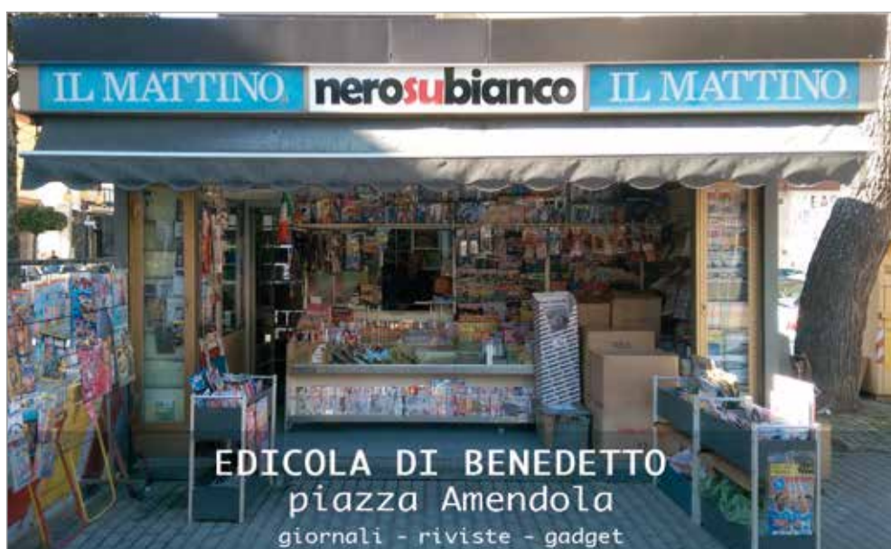
EDICOLA DI BENEDETTO piazza Amendola giornali - riviste - gadget

CAFÈ CATINO VILLA COMUNALE BAR ROMA VIA BELVEDERE NONSOLOFUMO VIA BELVEDERE ENI CAFÈ VIA BELVEDERE EDICOLA LA NOTIZIA VIA BELVEDERE CAFÈ BELVEDERE VIA BELVEDERE