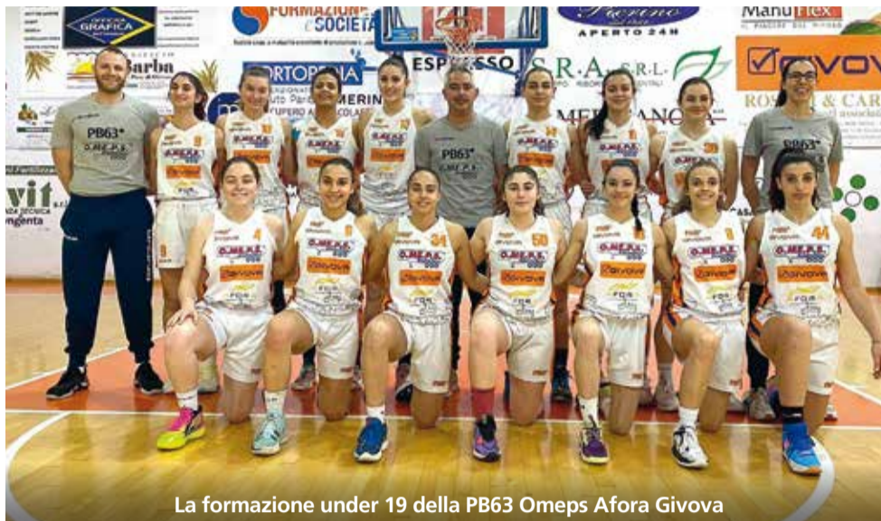
La formazione under 19 della PB63 Omeps Afora Givova

La prima semifinale, al meglio di tre partite, ci sarà domenica 7 maggio; sebbene Battipaglia avrà il fattore campo a sfavore (gara 1 e l'eventuale gara 3 si giocheranno a La Spezia, allo Zauli si disputerà solo la gara 2), si presenterà all'appuntamento in eccellenti condizioni fisiche, tecniche e mentali, pronta a firmare l'ennesima