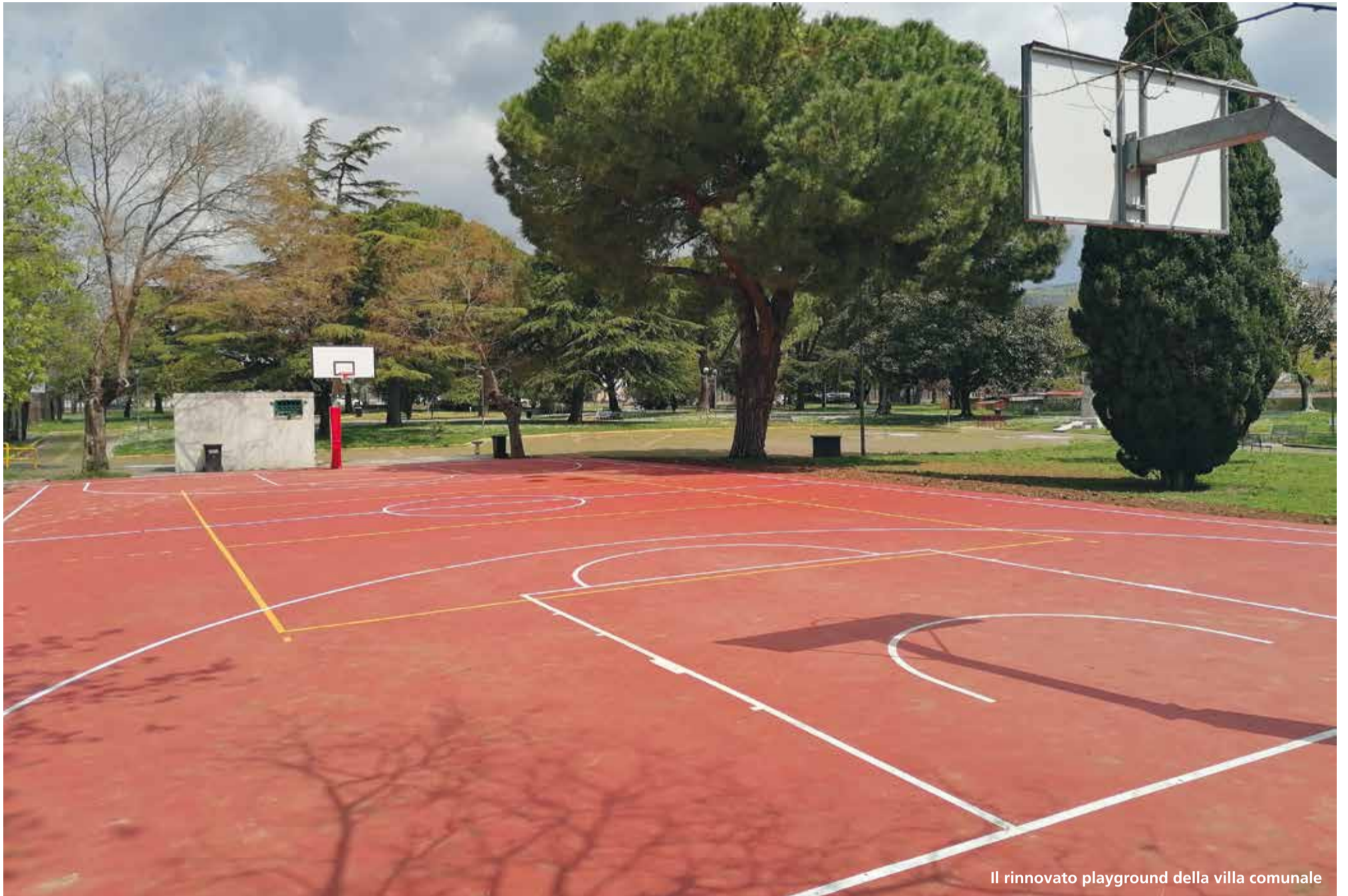
Il rinnovato playground della villa comunale