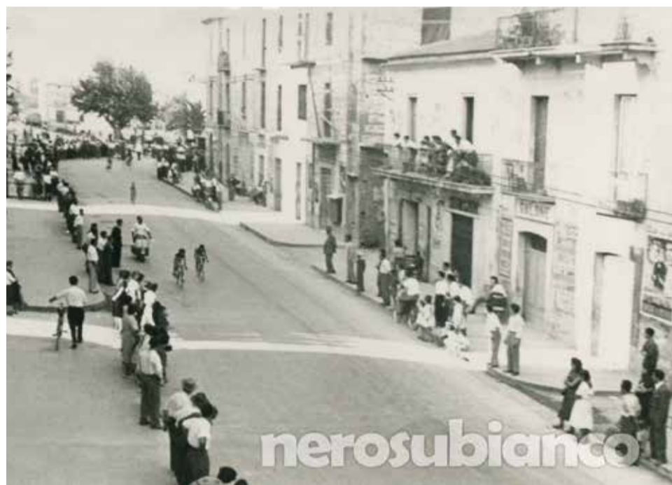
1953. Gara ciclistica di bambini.