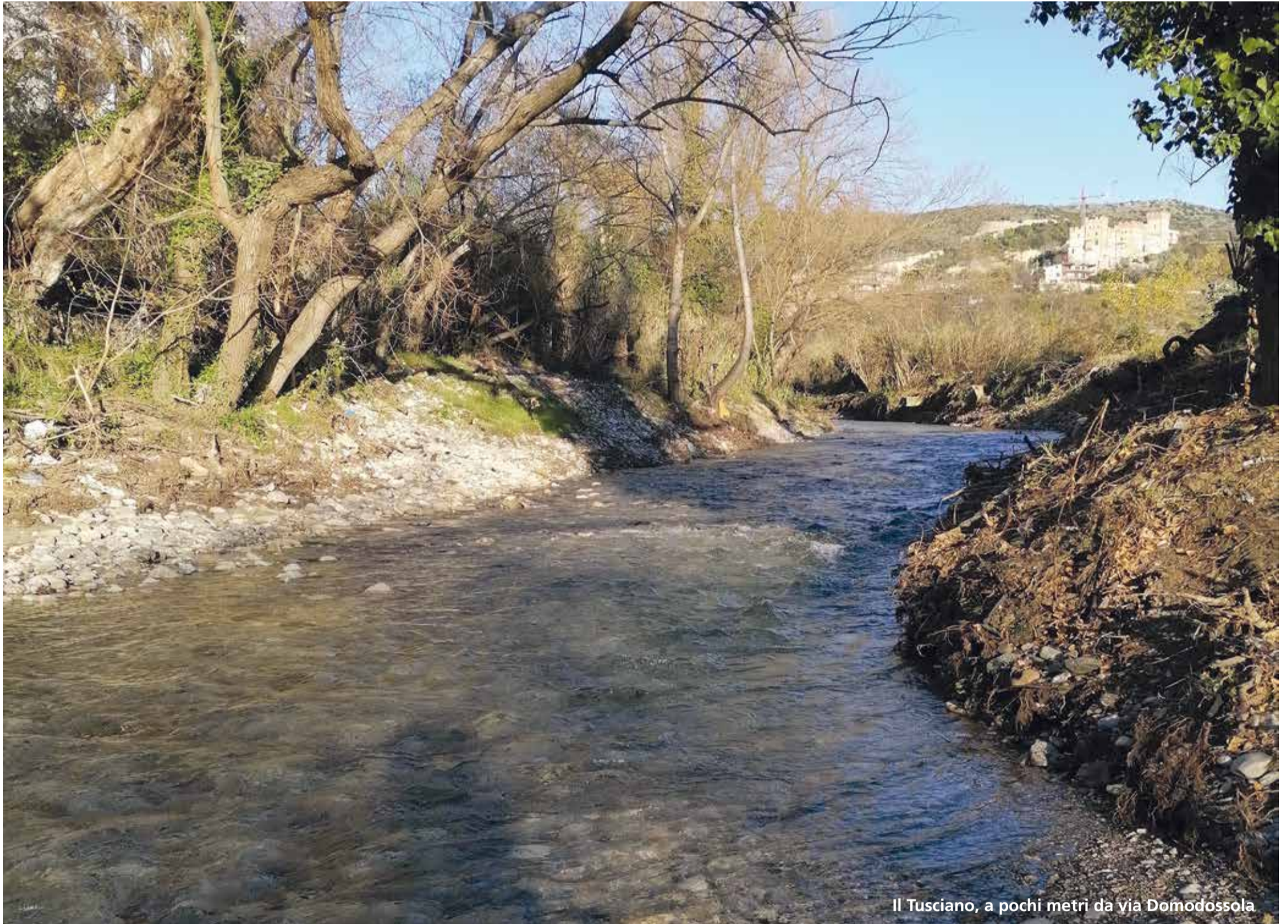
Il Tusciano, a pochi metri da via Domodossola