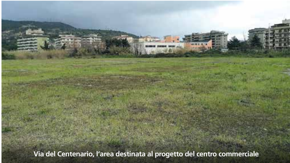
Via del Centenario, l'area destinata al progetto del centro commerciale