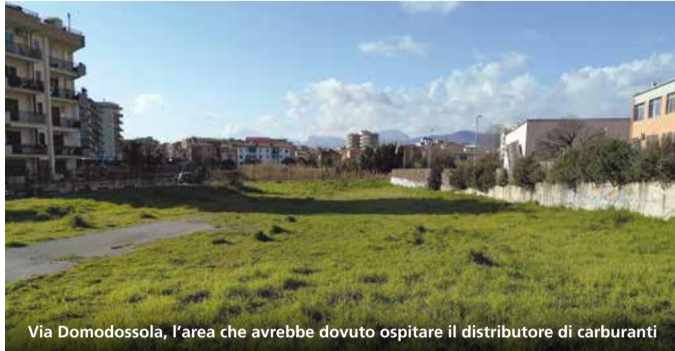
Via Domodossola, l'area che avrebbe dovuto ospitare il distributore di carburanti

A stupire l'intera città la tempistica del provvedimento, visto che da quando il progetto era stato presentato ed era iniziata una forte discussione politica che aveva visto contrapporsi maggioranza, minoranza e comitati cittadini, con un ricorso al Tar da parte di questi ultimi contrari fermamente al distributore, vi erano state anche tre varianti da parte dei proponenti privati,