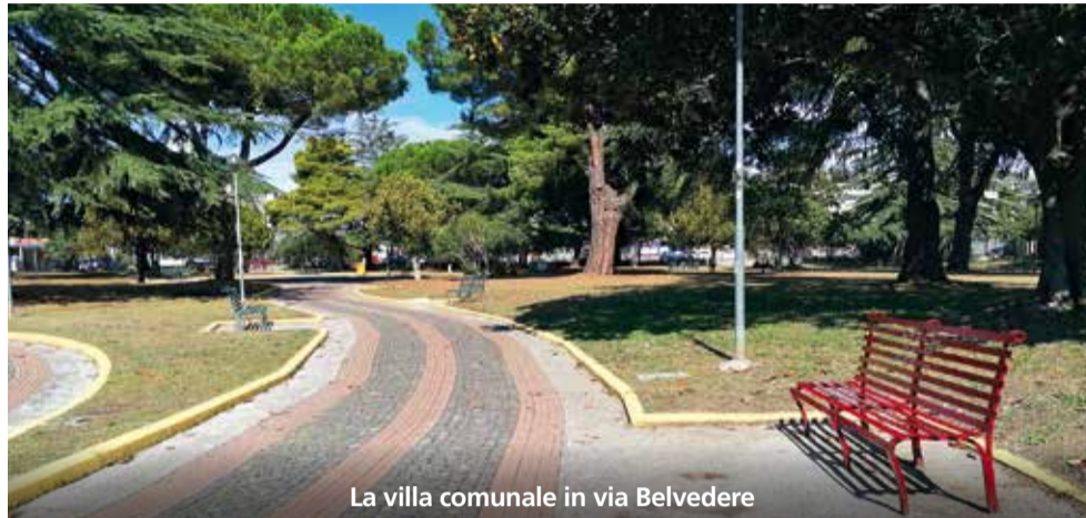
La villa comunale in via Belvedere

Ho scelto di dirlo oggi anche perché nell'ultimo mese ci sono state due meravigliose iniziative, promosse da associazioni e da meritevoli cittadini: sia le "invasioni botaniche" che la "festa dell'albero" hanno avuto, infatti, una confortante partecipazione – come riportato su questo e sul precedente numero di Nero su Bianco – culminata con la piantumazione di quattro alberi (nei tre giardini pubblici e in piazza Moro). Un segnale forte lanciato dalla nostra comunità e un monito per la nuova amministrazione comunale: i cittadini non sempre sono distratti, sanno cosa vogliono e chiedono di ottenerlo. Così, l'autunno battipagliese si è tinto inaspettatamente di verde.