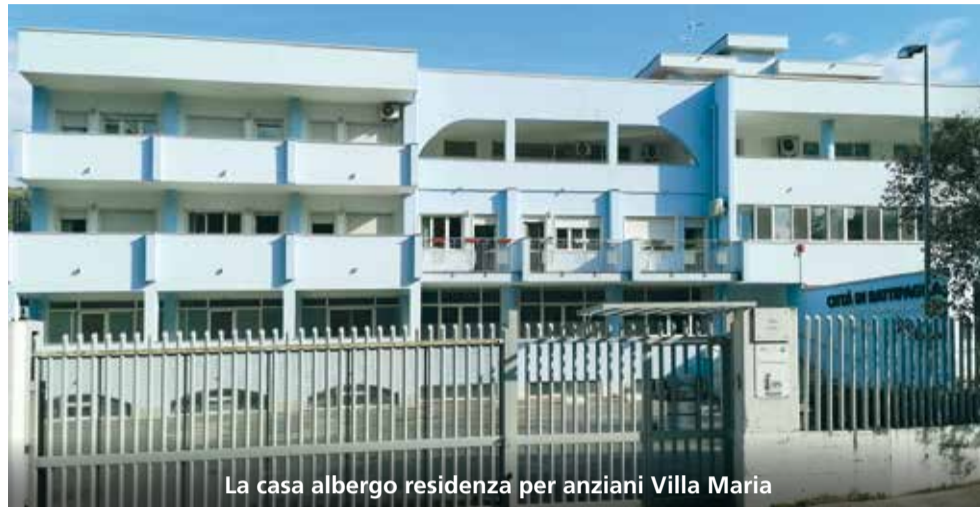
La casa albergo residenza per anziani Villa Maria

Nel frattempo, il Comune scopre che la società a cui l'Ati si era rivolta per la polizza fideiussoria non era iscritta all'Ivass, fatto che rendeva piuttosto aleatoria la polizza in caso di mancati pagamenti. Allo stesso tempo, controllando i versamenti, lo scoperto della concessionaria risultò enorme. Per la