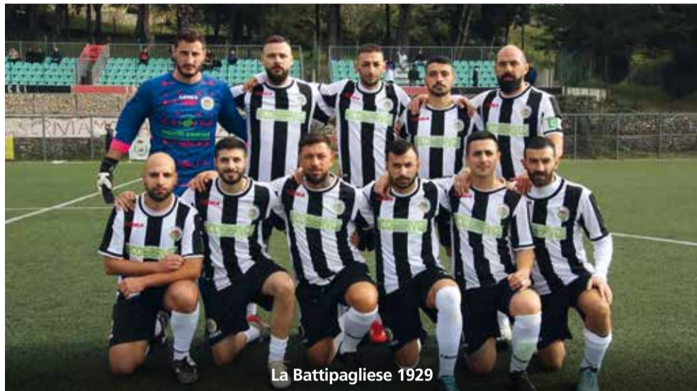
La Battipagliese 1929