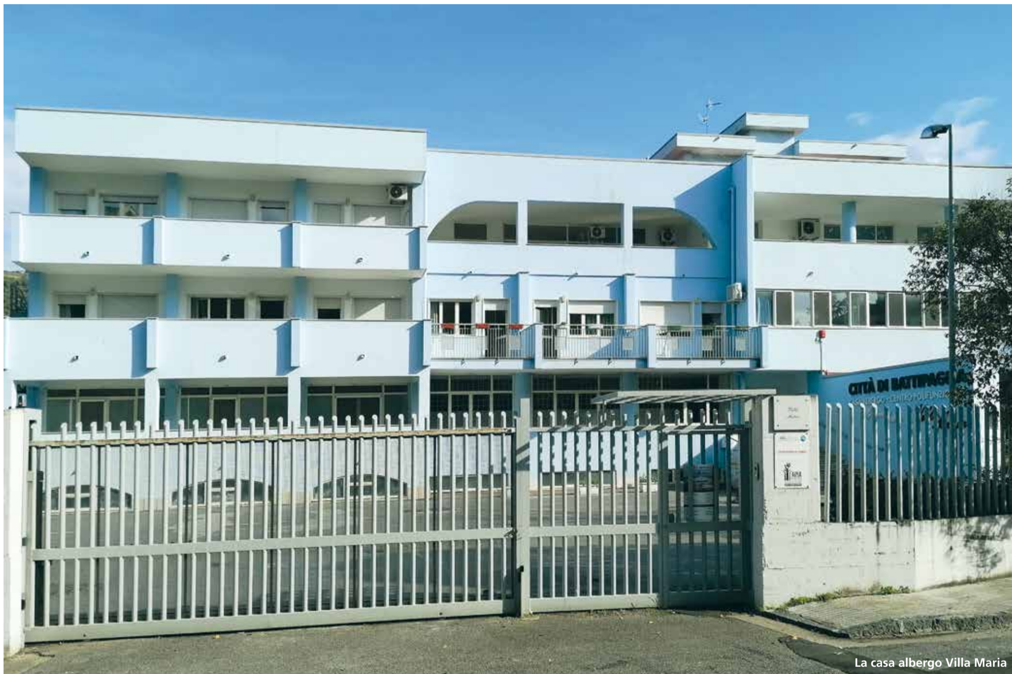
La casa albergo Villa Maria