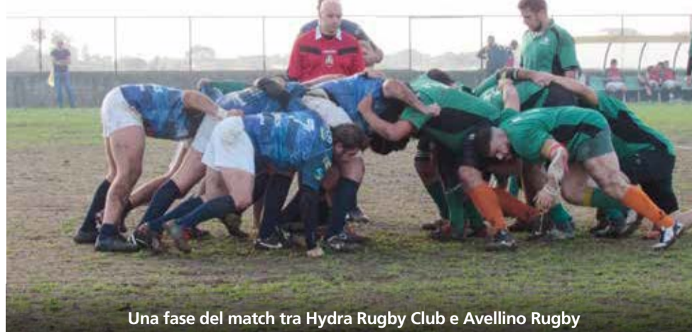
Una fase del match tra Hydra Rugby Club e Avellino Rugby