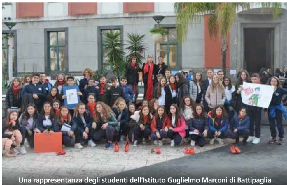
Una rappresentanza degli studenti dell'Istituto Guglielmo Marconi di Battipaglia

Lunedì 25 novembre, la scuola Guglielmo Marconi ha contribuito, insieme alle altre scuole di Battipaglia, a una manifestazione con l'obiettivo di informare, sensibilizzare e prevenire un problema drammaticamente attuale: la violenza sulle donne. Il raduno, in piazza Amendola, è iniziato con una testimonianza di una donna, la cui madre fu la vittima di un femminicidio a Battipaglia.