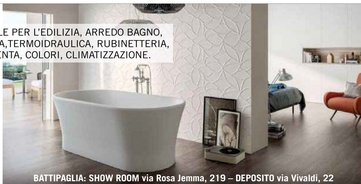
BATTIPAGLIA: SHOW ROOM via Rosa Jemma, 219 – DEPOSITO via Vivaldi, 22