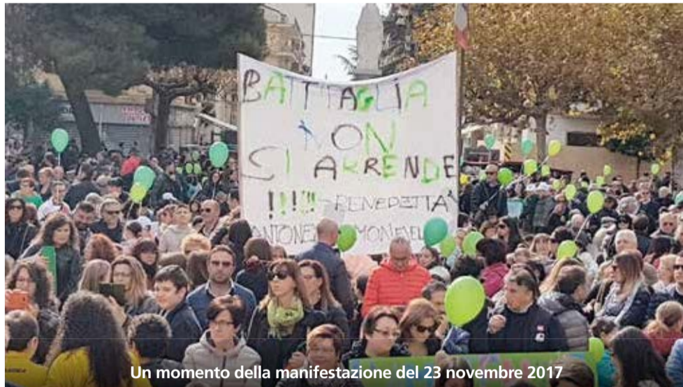
Un momento della manifestazione del 23 novembre 2017