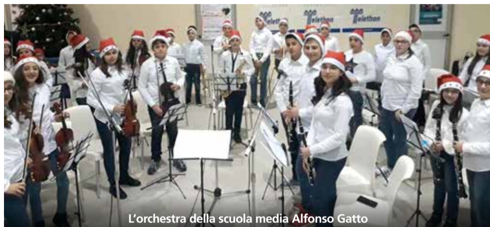
L'orchestra della scuola media Alfonso Gatto

Si è aperta sulle note di Carmina Burana di Carl Orff la manifestazione "Dona con il cuore", organizzata per raccogliere fondi destinati a sostenere la ricerca sulla distrofia muscolare, in favore della fondazione Telethon.