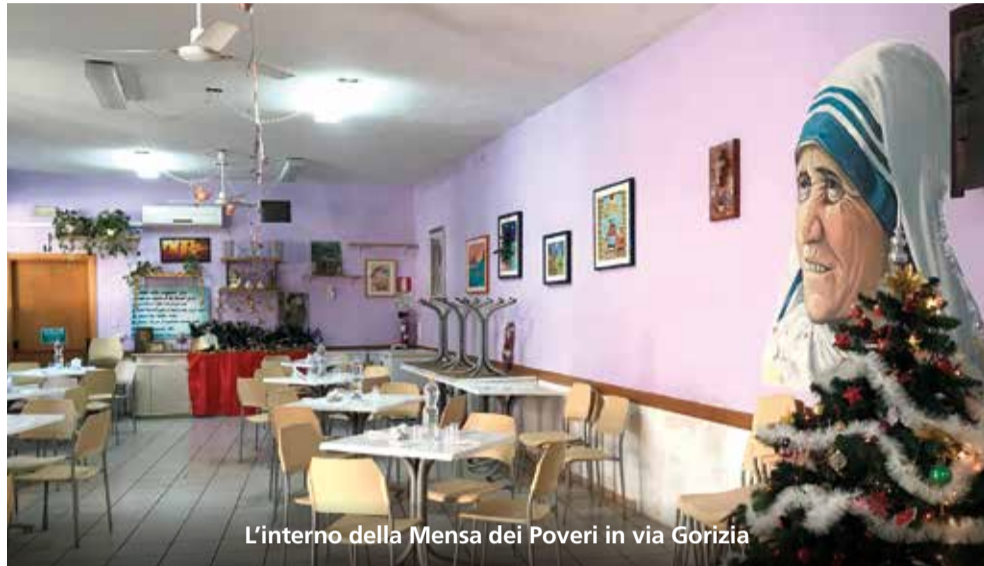
L'interno della Mensa dei Poveri in via Gorizia