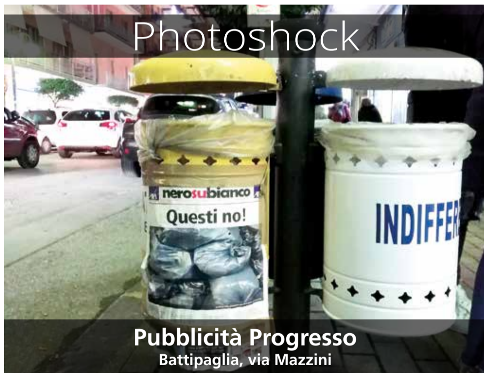
Publicità Progresso Battipaglia, via Mazzini