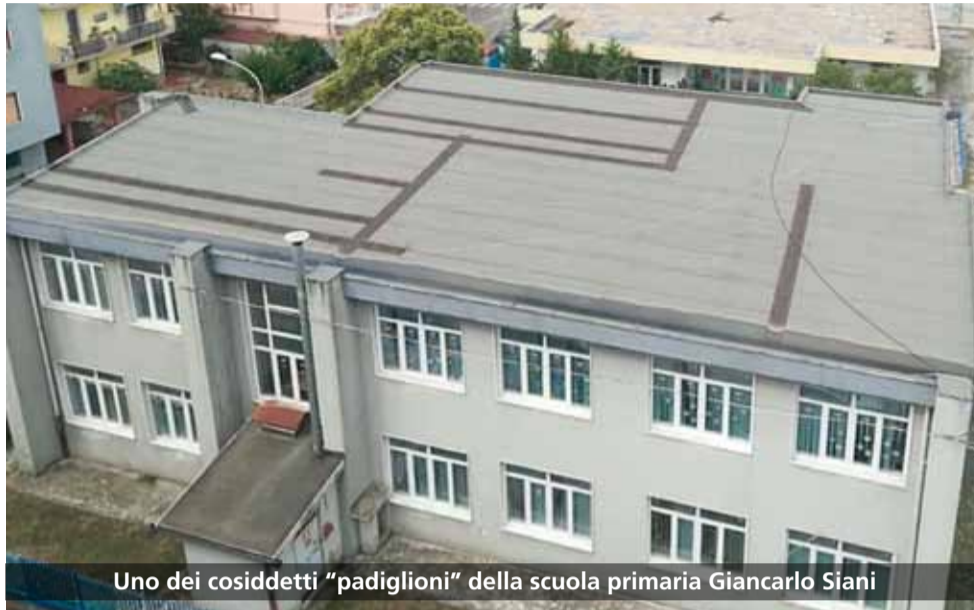
Uno dei cosiddetti "padiglioni" della scuola primaria Giancarlo Siani

La notizia arriva improvvisa come un temporale estivo, alla fine di agosto. Da allora in città non si parla d'altro, anche perché non si tratta della solita polemica alimentata dai social network o dell'ennesimo litigio in consiglio comunale. La novità è di quelle che cambiano la routine giornaliera di centinaia di famiglie battipagliesi: quest'anno resteranno chiuse le scuole Fiorentino e Siani, scuola d'infanzia, primaria e secondaria di primo grado (asilo, elementari e medie, per semplificare). Da quest'anno e per sempre, visto che saranno entrambe demolite. Si parla di oltre ottocento alunni costretti ad "emigrare" verso altri edifici. Perché? Da perizie tecniche effettuate risultano entrambe vulnerabili in caso di terremoto. Questa la notizia, ridotta all'osso. Ma vediamo come il fatto è stato interpretato dalle par-