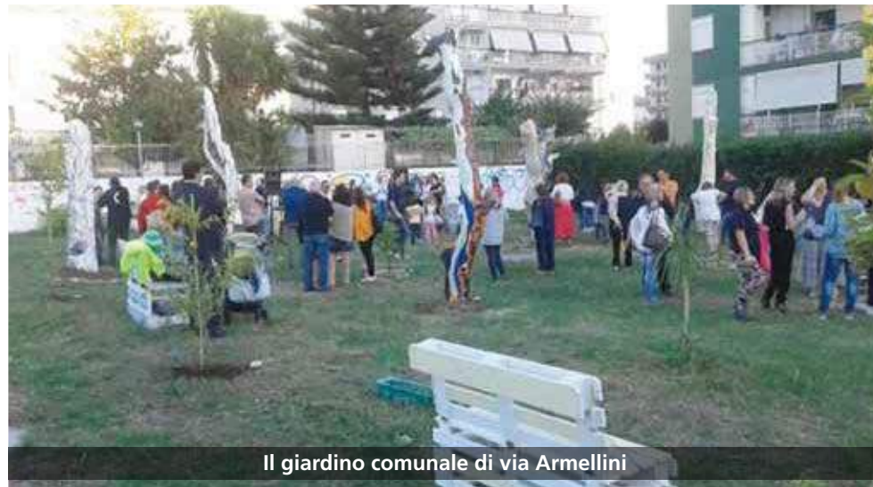
Il giardino comunale di via Armellini

Qualche settimana fa, con l'associazione Civica Mente, abbiamo inaugurato il giardino pubblico di via Armellini. I caratteri simbolici sono evidenti: un bene privato (della famiglia Barra) donato al Comune per un uso pubblico. E già questa è una notizia. Di solito, se si ha un terreno, si cerca il modo (trasparente o meno) per farlo diventare edificabile, per sbatterci sopra quintali di cemento, per monetizzare. Ma per fortuna non ci siamo imbattuti in privati di questo genere.