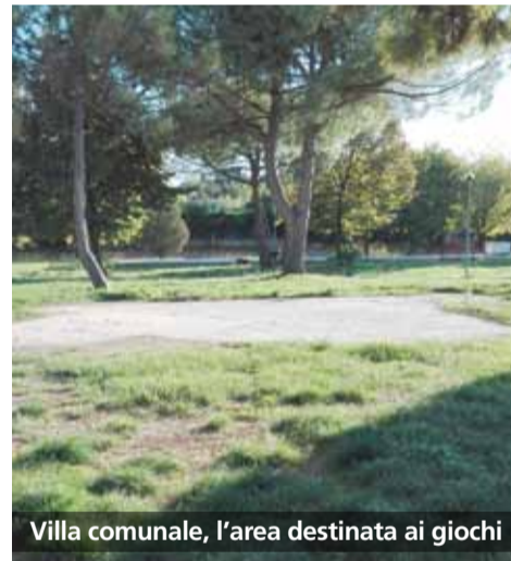
Villa comunale, l'area destinata ai giochi

Che fine hanno fatto le aree attrezzate per i bambini? Dopo numerose segnalazioni da parte dei lettori, abbiamo deciso approfondire la questione. Dal Comune, in forma del tutto ufficiosa, fanno sapere che i giochi sono stati rimossi a causa della loro pericolosità dovuta all'usura e agli atti vandalici che ne avevano danneggiato