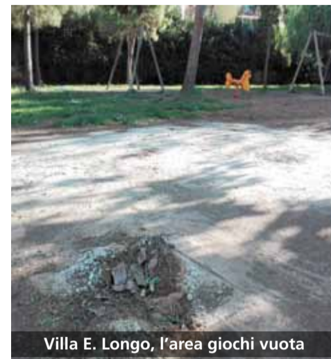
Villa E. Longo, l'area giochi vuota

alcuni elementi fondamentali per la sicurezza del bambino. Per quanto riguarda poi la villa comunale di via Belvedere, sembra che la struttura non fosse nemmeno più a norma.