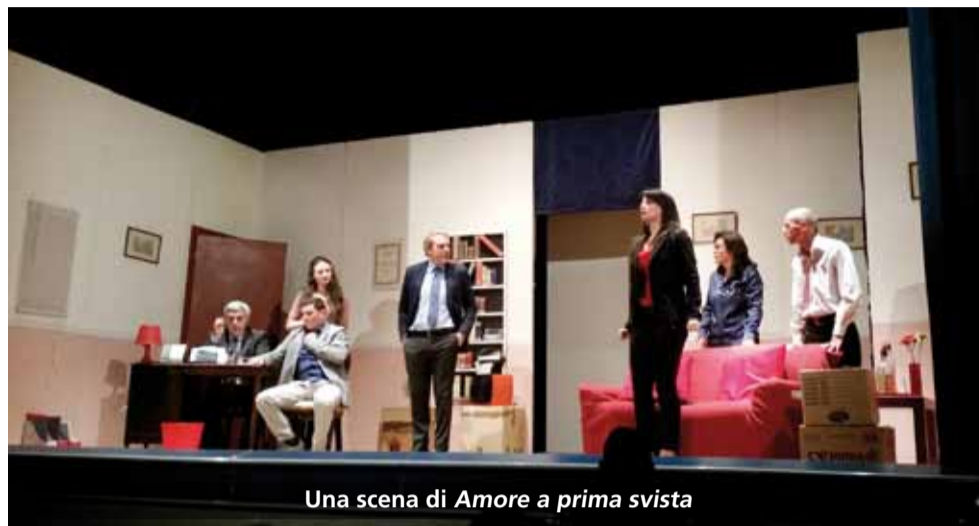
Una scena di Amore a prima svista

Samarcanda Teatro , la più longeva associazione teatrale battipagliese, quest'anno celebra il ventennale della sua costituzione. Momento culminante dei festeggiamenti è la rassegna teatrale "Domenica a teatro" , realizzata con la collaborazione del Teatro Bertoni di Battipaglia, del Comitato provinciale di Salerno di FITA e con il patrocinio gratuito del Comune di Battipaglia.