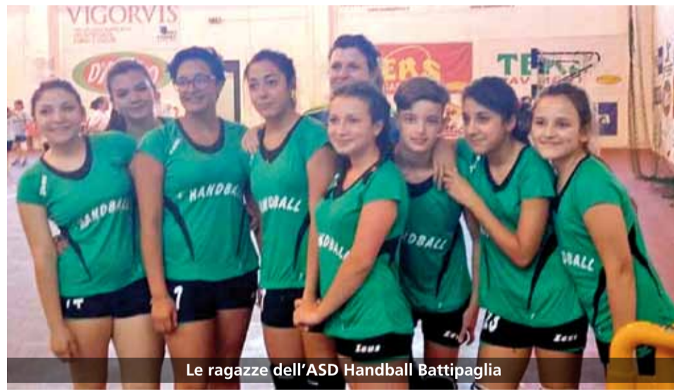
Le ragazze dell'ASD Handball Battipaglia