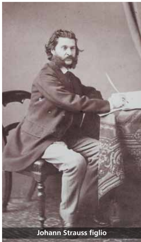
Johann Strauss figlio

Al di là della contesa paternità, quello che attira la nostra curiosità è il modo in cui una forma musicale riesca ad adeguarsi agli sviluppi e alla metamorfosi di una pratica, in questo caso quella della danza, rispecchiandone le caratteristiche e rendendosi conforme alle diverse esigenze coreiche.