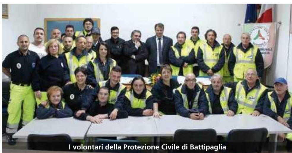
I volontari della Protezione Civile di Battipaglia