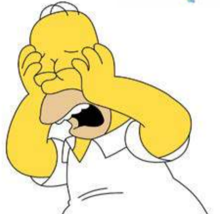
Uno dei calvi più noti, Homer Simpson

certamente importante ma non di meno di una personalità ben costruita.