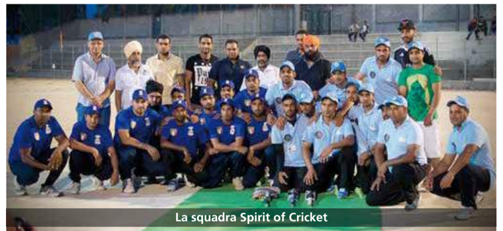
La squadra Spirit of Cricket

Un colpo di cricket per abbattere i muri del razzismo e favorire l'integrazione fra i popoli. Sulla scorta di quanto fatto dal Comune di Capaccio, anche il Comune di Battipaglia , in collaborazione con Acli, ha contribuito alla nascita di Spirit of Cricket , una squadra praticante lo sport molto diffuso soprattutto nei paesi anglosassoni e in India, e composta da giocatori di origine straniera.