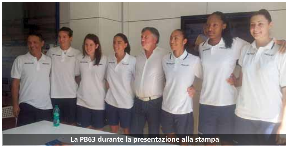
La PB63 durante la presentazione alla stampa