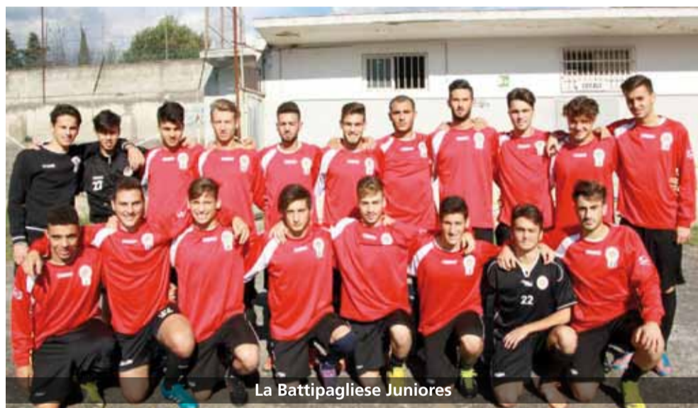
La Battipagliese Juniores

La categoria juniores raggruppa, come detto, gli atleti più giovani e troppo spesso viene sottovalutata o ignorata dalle società stesse. Fa sempre piacere, quindi, sottolineare le eccellenze sportive della nostra città, soprattutto quando si tratta di uno sport seguito come il calcio, mai come oggi nell'occhio del ciclone per una serie di "tendenze" molto discutibili. Nel calcio moderno, inoltre, i giovani ragazzi italiani non vengono valorizzati perché scartati a priori rispetto a coetanei di altre nazioni, a causa di un'ormai diffusa ed errata concezione che vede i ragazzi nostrani meno validi rispetto ai giovani stranieri. La speranza è che il sistema-calcio,