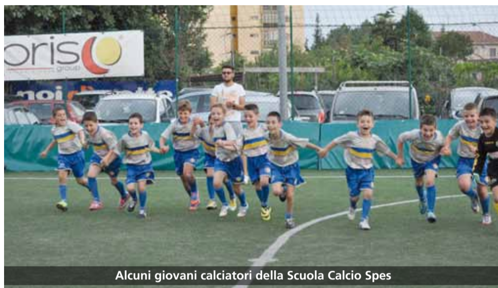
Alcuni giovani calciatori della Scuola Calcio Spes