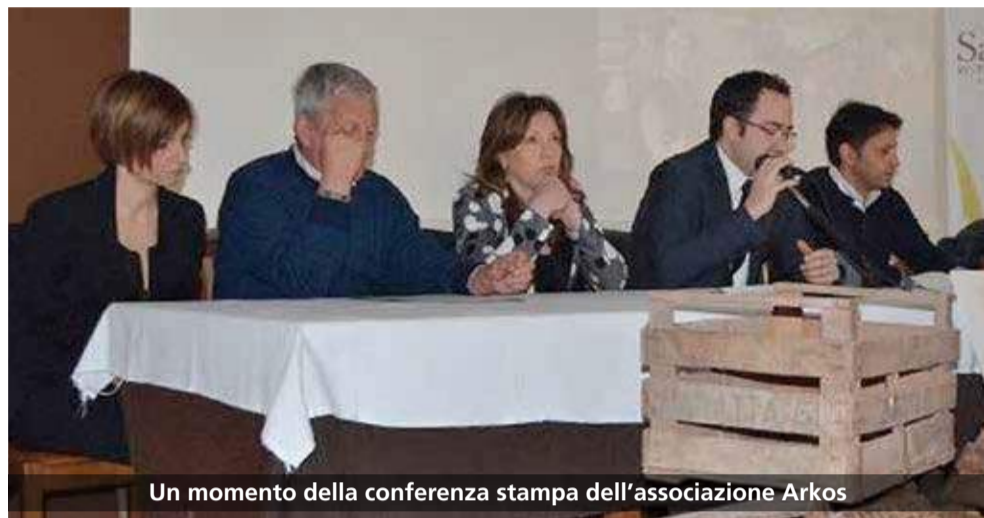
Un momento della conferenza stampa dell'associazione Arkos

Si è tenuta sabato scorso, presso la pizzeria Sandokan, la conferenza stampa di presentazione dell'associazione Arkos e del progetto di recupero della varietà di pomodoro fiaschello battipagliese .