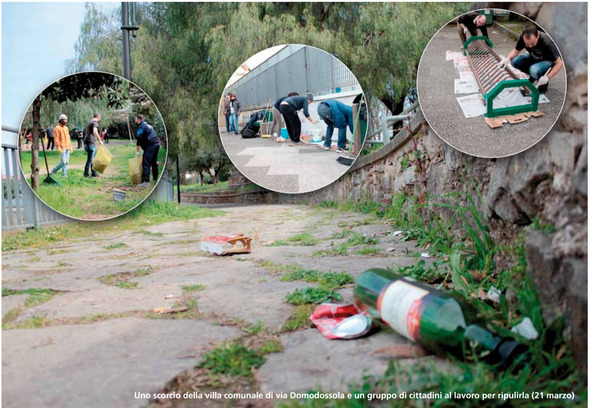
Uno scorcio della villa comunale di via Domodossola e un gruppo di cittadini al lavoro per ripulirla (21 marzo)