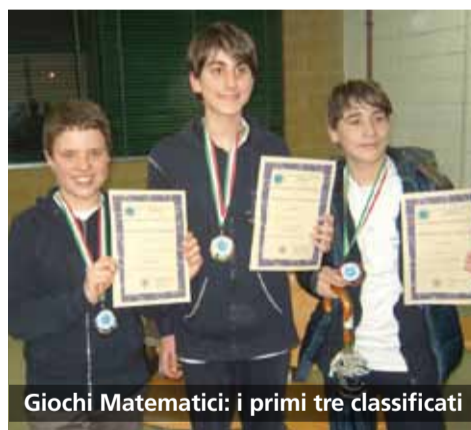
Giochi Matematici: i primi tre classificati

Mercoledì 4 marzo si è svolta ad Anghiara (Sa) la finale provinciale dei Giochi Matematici del Mediterraneo , manifestazione organizzata dall'Accademia italiana per la promozione della matematica di Palermo. Alla finale provinciale si sono ritrovati, dopo aver superato selezioni locali, i migliori alunni delle scuole elementari e delle scuole medie, e le prime e seconde classi degli istituti superiori. Gli alunni di ogni categoria si sono confrontati su venti quesiti matematici da risolvere nel tempo limite di due