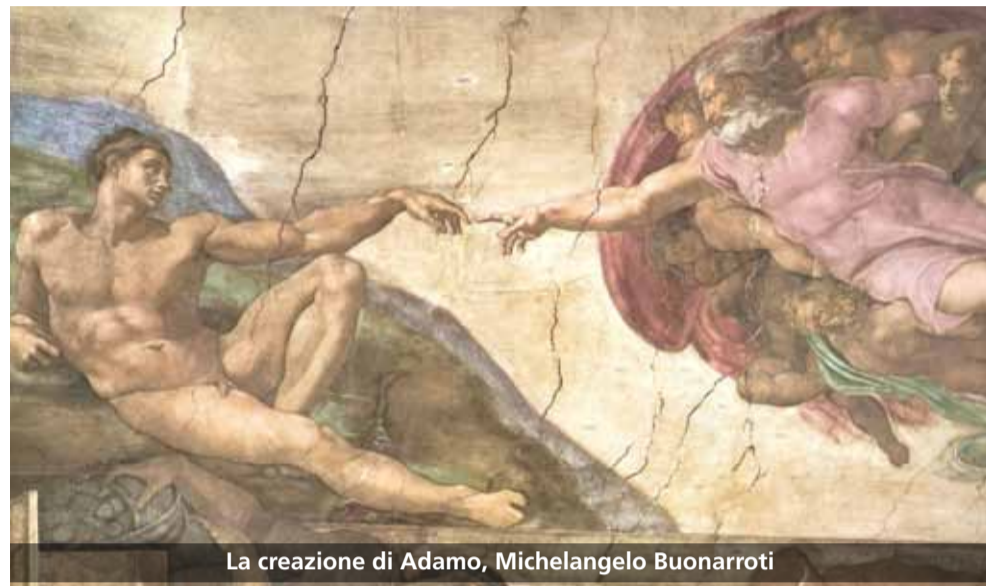
La creazione di Adamo, Michelangelo Buonarroti

Per molte persone la presenza della fede nella vita è molto importante. In particolare, pazienti depressi, con disturbi dell'ansia o altre forme di disagio psicologico, che hanno un " credo " nella vita, mostrano una migliore prognosi rispetto a chi non lo ha. Un disagio psicologico, talvolta molto grave, non è facilmente compreso da chi lo esperisce, quindi appare compromessa la capacità di guardare a se stessi, a volte la persona perde la gioia di vivere e, soprattutto, la voglia di vivere. La fede può essere definita come un " movimento interiore attivo verso la vita " e se c'è movimento, non c'è morte. Il che presuppone un'azione dell'uomo o una relazione, che coinvolge il suo mondo interiore e il rapporto con l'esterno. Vi è una connessione tra crescente incidenza dei disturbi psichiatrici (si pensi all'alto tasso di suicidi, all'aumento dei disturbi depressivi) e della disillusione, e perdita della fede. Ma le condizioni economiche precarie, la perdita del lavoro, le malattie mortali possono mettere in discussione le credenze religiose; molti uomini perdono la fede e chi perde la fede perde la voglia di lottare. In una situazione di crisi, gli unici a sopravvivere sono quelli per cui la vita ha un significato. Nel racconto del "padre e del bambino" scoppia un grave incendio in un palazzo. Un bambino rimane nell'abitazione, circondato dalle fiamme ardenti. Il padre, in salvo, nella strada, grida al bambino di buttarsi dalla finestra perché sotto vi è lui,