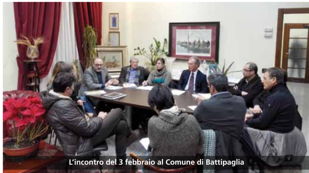
L'incontro del 3 febbraio al Comune di Battipaglia

«Affrontare insieme problemi dell'area, soprattutto nella zona costiera, per provare a progettare qualcosa in comune, per dare più sostanza e forza agli interventi, ma anche per aggredire in modo più convincente le criticità che sono evidenti e condivise». Queste le parole del presidente della Commissione straordinaria Gerlando Iorio a conclusione della riunione tenutasi nel Comune di Battipaglia lo scorso 3 febbraio, cui hanno partecipato i delegati del distretto turistico Sele-Picentini Sele Coast e i rappresentanti degli Uffici tecnici dei Comuni di Battipaglia, Pontecagnano ed Eboli.