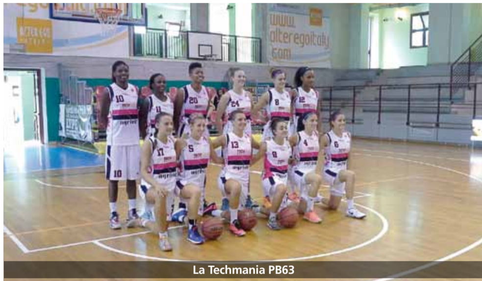
La Techmania PB63

Non poteva essere certo la trasferta in casa della squadra Campione d'Italia quella da cui la Techmania PB63 si aspettava punti utili per la classifica. Infatti, da Schio è arrivata puntuale e ampiamente pronosticata la sconfitta di Battipaglia con un divario di 40 punti. Il margine eclatante è tuttavia in gran parte dipeso dalle numerose assenze tra le file del team di Rossini che ha dovuto rinunciare, per problemi diversi, al capitano Orazio, a Treffers e a Tunstull. Così decimata, la Techmania PB63 non è entrata mai in partita dovendo anche modificare il consueto approccio alla gara, iniziando con una difesa a zona nell'evidente tentativo di preservare dai falli le giocatrici disponibili del già falciadiato organico. Effettivamente il quintetto schierato da Riga non è stato proprio impeccabile nell'esecuzione del piano difensivo e le avversarie hanno spesso trovato facili varchi nel pitturato. I parziali di tempo sono espliciti: 20 a 8, 40 a 23, 52 a 31 e 79 a 39 con Battipaglia che ha giocato alla pari con la più blasonata e completa rivale solo all'inizio della ripresa, dopo l'intervallo lungo, riuscendo addirittura a piazzare un parziale favorevole di 8 a 2 che per un momento, sul meno 11, ha fatto sperare nell'impossibile miracolo della rimonta. Due bombe consecutive di Masciadri, per la Famila Schio , hanno riportato tutti con i piedi per terra e indirizzato definitivamente l'inerzia di un match, ormai senza più storia.