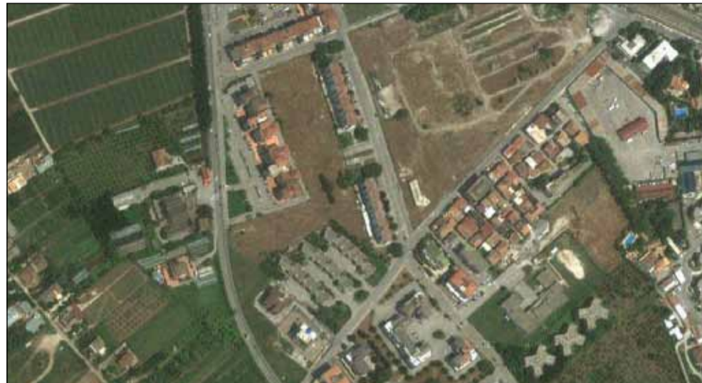
L'area del rione Turco indicata nel PUA

Dopo anni dall'approvazione commissariale del PUA di via Carmine Turco, finalmente potrebbe essere la volta buona per la sua definitiva adozione