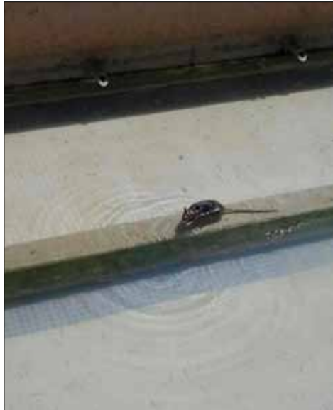
Un ratto nella fontana di piazza Aldo Moro

Nessun quartiere è esente dall'invasione e la cosa inizia a creare non pochi disagi, tanto che la cittadinanza, ormai esasperata, ha ravvisato nella raccolta dei rifiuti porta