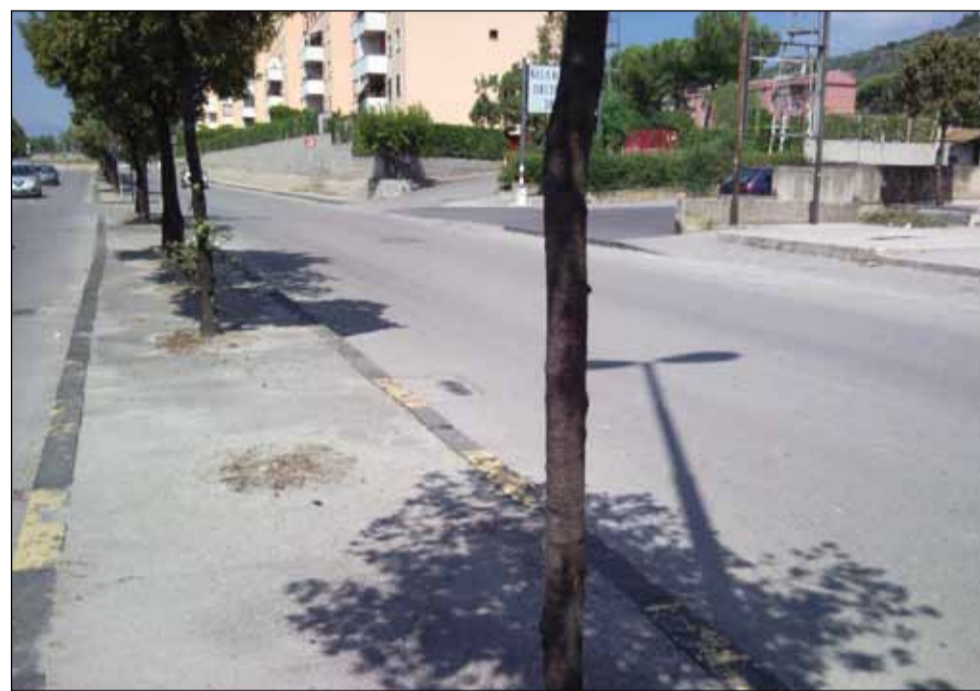
Viale della Libertà

analisi la Strada Statale 18, che è anche la zona dove gli incidenti risultano essere più gravi, come dimostrato dall'ultimo che ha tenuto l'intera cittadinanza col fiato sospeso per la sorte delle giovani vittime. Etica per il Buon Governo ha più volte chiesto in Consiglio Comunale di affrontare questa problematica, specie in riferimento agli sbocchi delle strade laterali spesso con visibilità limitata da cartellonistica pubblicitaria. La scarsissima illuminazione e l'elevata velocità delle vetture fanno il resto. Purtroppo non si potrà mai azzerare il numero di morti sulle strade ma, non solo ognuno di noi dovrebbe essere più accorto e responsabile quando si mette alla guida della propria autovettura, ma anche l'am-