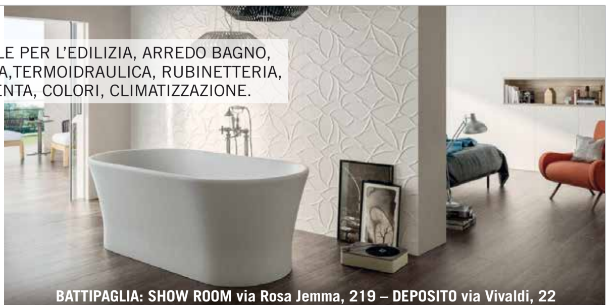
BATTIPAGLIA: SHOW ROOM via Rosa Jemma, 219 – DEPOSITO via Vivaldi, 22