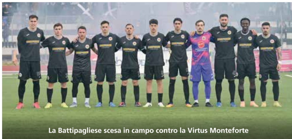
La Battipagliese scesa in campo contro la Virtus Monteforte

Tre giornate, solo tre giornate alla fine della stagione regolare. Ancora tre partite che possono dire tutto e il contrario di tutto, in una serie di