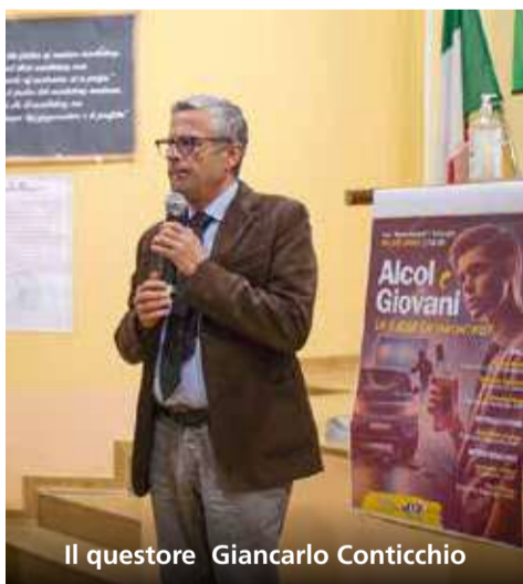
Il questore Giancarlo Conticchio

"Mi presento. Mi chiamo Giancarlo e sono uno sbirro". In questo modo il questore di Salerno, Giancarlo Conticchio , si è presentato lo scorso 28 marzo agli alunni delle classi quarte dell' Istituto d'istruzione superiore Besta Gloriosi di Battipaglia, catturando immediatamente l'attenzione di tutti gli studenti, anche di quelli più refrattari alle regole. Del resto, l'argomento proposto loro "Alcol e giovani: sai a cosa vai incontro?", attraverso la preziosa presenza dell'Associazione Nazionale Funzionari Polizia di Stato (ANFP),