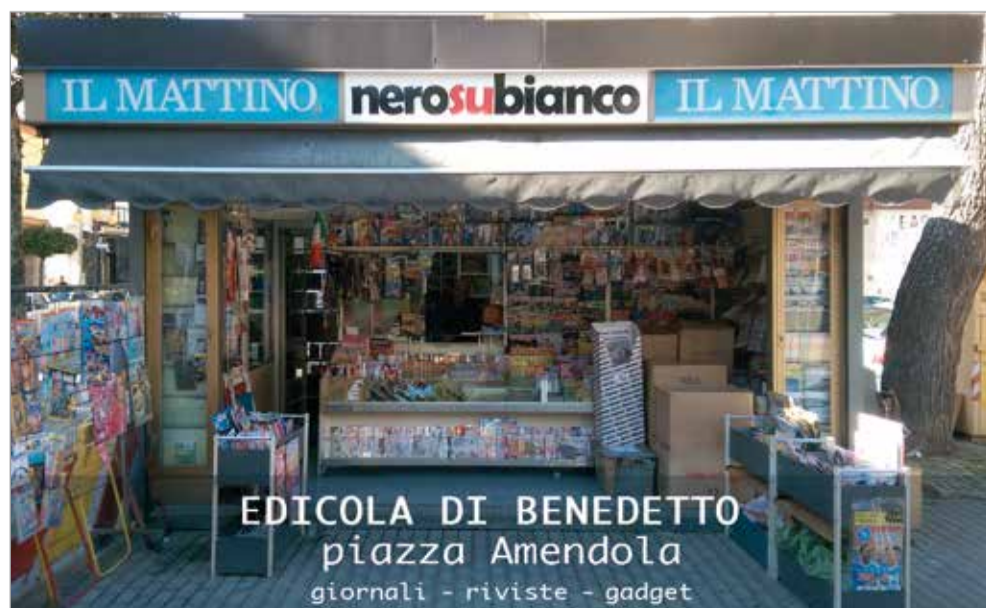
EDICOLA DI BENEDETTO piazza Amendola giornali - riviste - gadget

Oltre che nelle attività elencate, il giornale si trova presso tutte le aziende sponsor